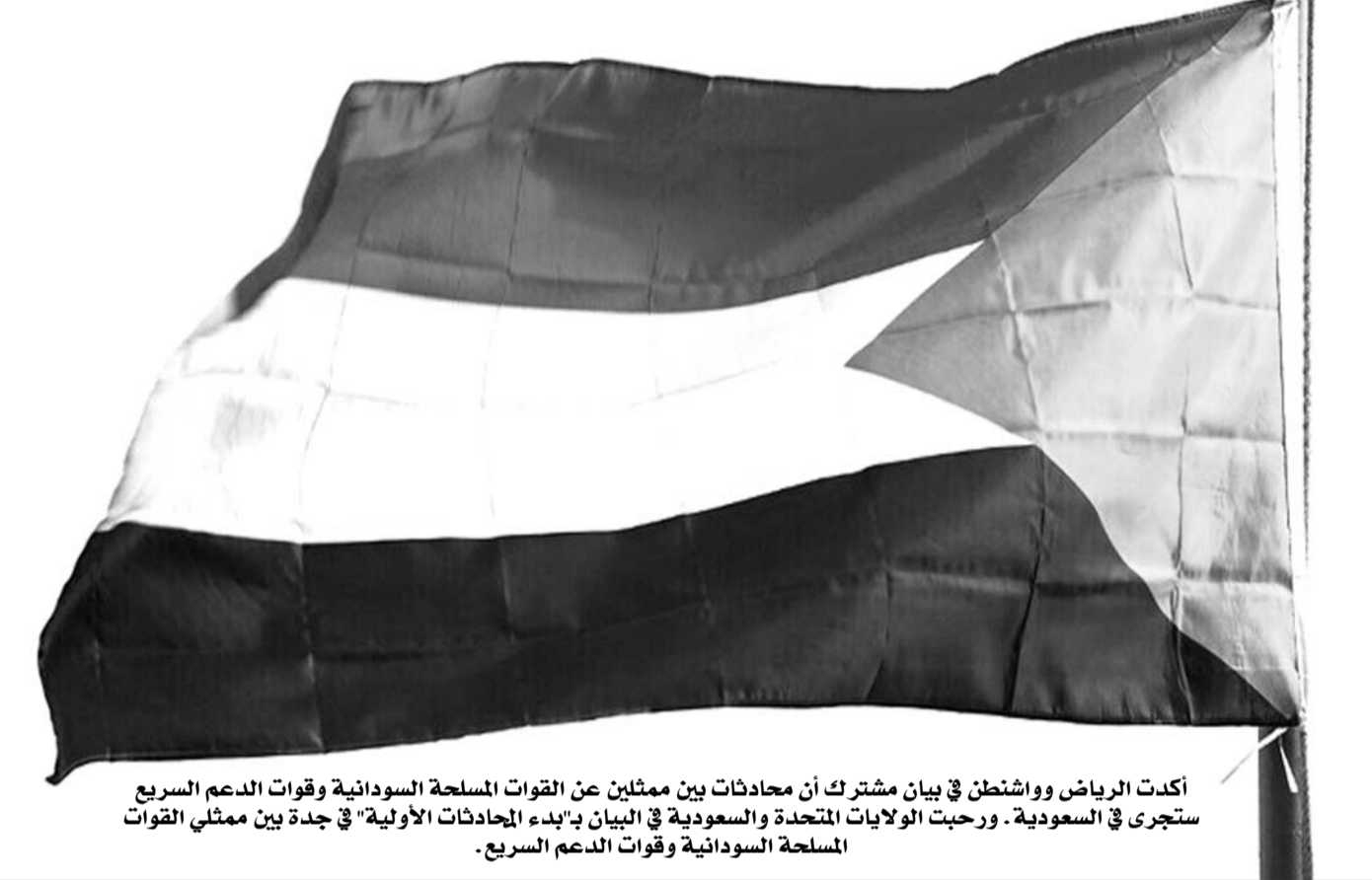
أكدت الرياض وواشنطن في بيان مشترك أن محادثات بين ممثلين عن القوات المسلحة السودانية وقوات الدعم السريع ستجرى في السعودية. ورحبت الولايات المتحدة والسعودية في البيان بـ"بدء المحادثات الأولية" في جدة بين ممثلي القوات المسلحة السودانية وقوات الدعم السريع.