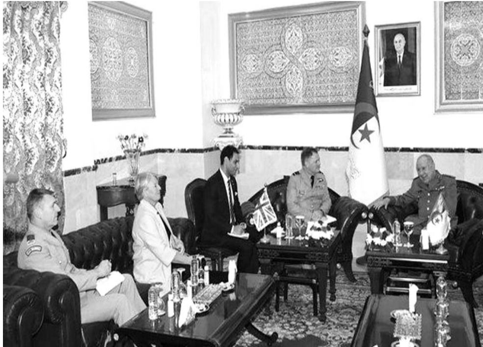
■ محمد ج

استقبل رئيس أركان الجيش الوطني الشعبي، الفريق أول السعيد شنقرية، أمس بالجزائر العاصمة، المستشار الأعلى للدفاع البريطاني لمنطقة الشرق الأوسط وشمال إفريقيا، مارشال إيليو، حسب ما أفاد به بيان لوزارة الدفاع الوطني.