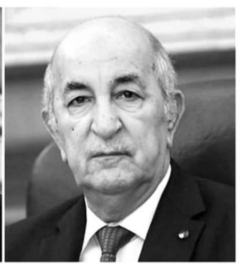
السيد عبد المجيد تبون، رئيس الجمهورية، السيد محمود عباس، وزير الخارجية والجالية الوطنية بالخارج، فلسطين.

وجاء في البيان: "تلقى، اليوم، رئيس الجمهورية، السيد عبد المجيد تبون، مكاملة هاتفية من رئيس الجمهورية الفرنسية، السيد إيمانويل ماكرون، تبادلا فيها التهنئة بمناسبة السنة الميلادية الجديدة، متمنين للشعبين دوام التقدم والازدهار". كما تناول الرئيسان، بالمناسبة، "قضايا تهم العلاقات الثنائية وتطرقت إلى زيارة الدولة التي سيؤديها السيد رئيس الجمهورية إلى فرنسا، حيث اتفقا على أن تكون خلال شهر ماي المقبل، وفقا لما تضمنه بيان رئاسة الجمهورية.