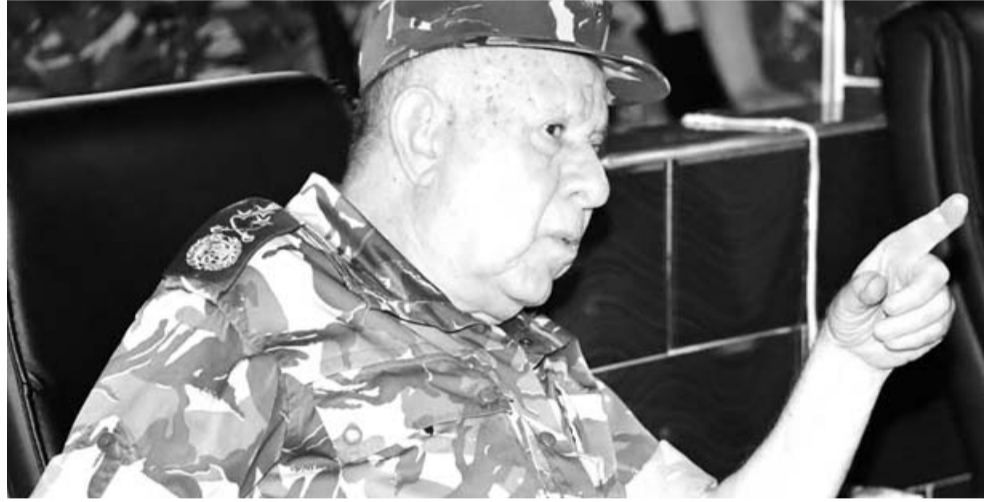
■ مليكة ب.

أشرف الفريق السعيد شنقرية، رئيس أركان الجيش الوطني الشعبي، مساء أول أمس، على تنفيذ تمرين تكتيكي ليلي بالذخيرة الحية بعنوان: "الصمود 2022"، نفذته وحدات القطاع العملياتي الجنوبي بتندوف، بمشاركة وحدات من مختلف القوات والأسلحة.