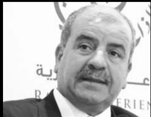
أوتلاين، نقلا عن مصادر على صلة بالتحقيق، فإن الوزير السابق قد وجهت له تهم ذات صلة بالفساد خلال فترة قيادته لقطاع الموارد المائية.

أمر قاضي التحقيق بالغرفة الثالثة بالتقطب الجزائي المتخصص لدى محكمة سيدي امحمد، بإيداع وزير الموارد المائية الأسبق، حسين نسيب الحبس المؤقت، وحسب المعلومات التي نشرها موقع النهار أونلاين، نقلا عن مصادر على صلة بالتحقيق، فإن الوزير السابق قد وجهت له تهم ذات صلة بالفساد خلال فترة قيادته لقطاع الموارد المائية.