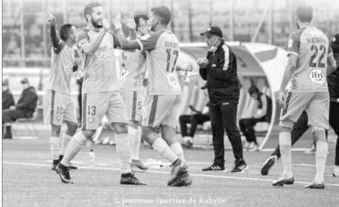
Jeunesse Sportive de Kabylie

اقتطع فريق شبيبة القبائل تأشيرة التأهل للدور نصف النهائي من منافسة كأس الكونفدرالية الإفريقية لكرة القدم، رغم التعادل الإيجابي 1-1 الذي فرضه عليه مساء أول أمس منافسه الصفاقسي التونسي بملعب أول نوفمبر بتيزي وزو، لحساب إياب ربع النهائي.