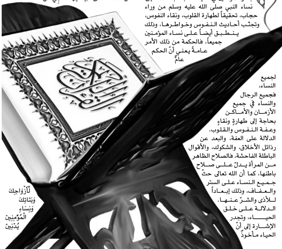
لَأَزْوَاجِكُمْ وَبَنَاتِكُمْ وَنِسَاءَ الْمُؤْمِنِينَ يُدْنِينَ

جميع النساء، فجميع الرجال والنساء في جميع الأزمان والأماكن بحاجة إلى طهارة ونقاء وعفة النفوس والقلوب، الدلالة على العفة، والبعد عن ردائل الأخلاق، والشكوك، والأقوال الباطلة الفاحشة، فالصلاح الظاهر من المرأة يدلّ على صلاح باطنها، كما أنّ الله تعالى حتّ جميع النساء على الستر والعفاف، وذلك إبعاداً للأذى والشر عنها، الدلالة على خلق الحياء، وتجدر الإشارة إلى أنّ الحياء مأخوذٌ